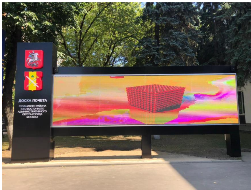
Управа Рязанского района, г. Москва, 1-я Новокузьминская ул., 10 7040мм*1920мм, шаг пикселя 4мм.