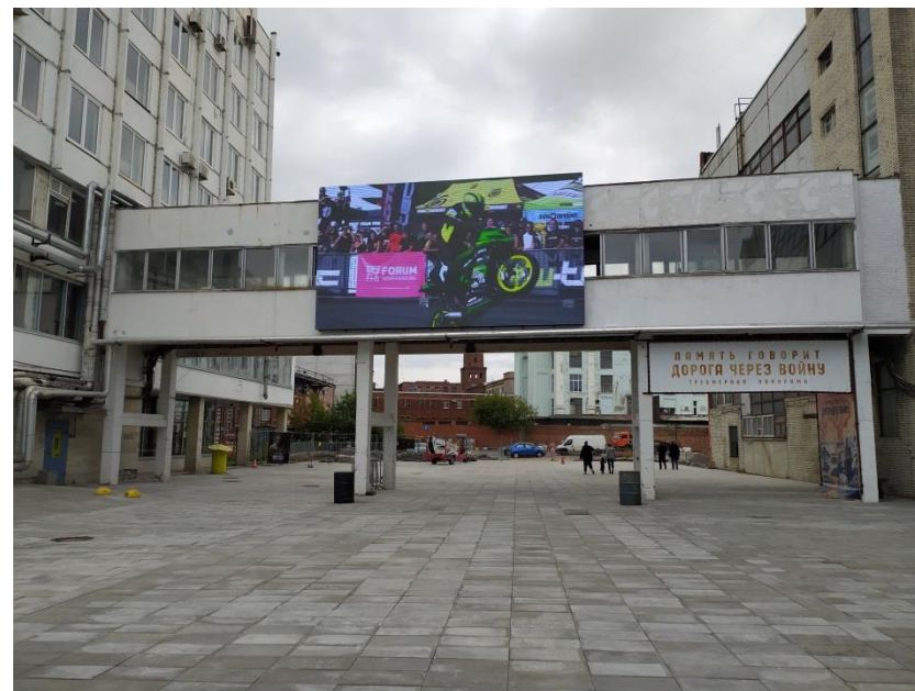
Креативное пространство «Севкабель Порт», г. Санкт-Петербург, Кожевенная линия, 40 8640мм*4800мм, шаг пикселя 5мм.